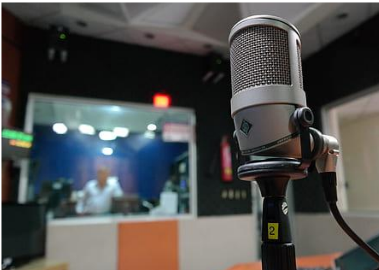
● Annexe 4 : Sitographie