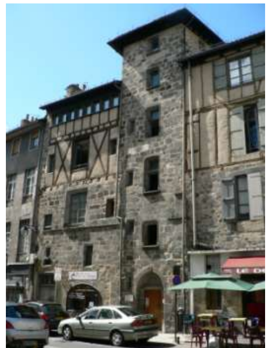
Doc 11 : A Aurillac, quelques maisons comprenant ou constituant des tours marquent l'affirmation d'un statut social supérieur.