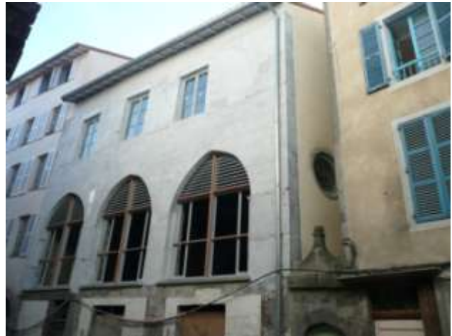
Doc 8 : Maisons romanes rue du collège (en cours de restauration)