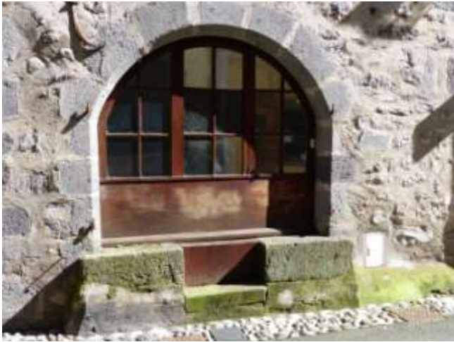
Doc 9 : Une échoppe rue des Dames

FLAURAUD (Vincent) Aurillac de A à z Editions Alan Sutton 2010