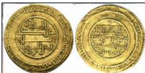
Doc 10 Trésor monétaire découvert en 1980 à Aurillac , il se compose de 24 dinars almoravides, 4 dinars hudides, 20 dinars murciens et 1 dinar almohade (total : 49 pièces). 48 de ces pièces ont été acquises par le Cabinet des Médailles en 1981 et 1 par le musée d'Aurillac. Elles étaient utilisées au XII e siècle