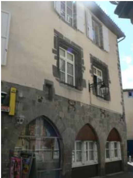
Doc 9 : Arcades en rez-de-chaussée au 6-8 rue du Collège