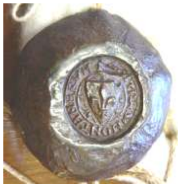
b- sceau de la commune d'Aurillac