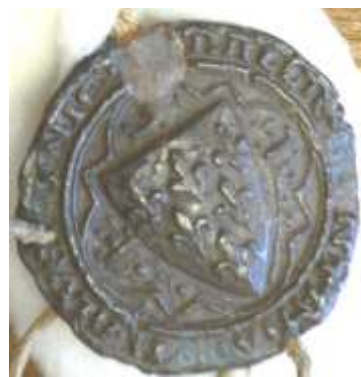
c- sceau du baillage des montagnes d'Auvergne, avec un écu fleurdelysé manifestant l'autorité royale