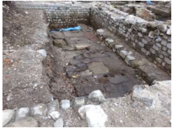
Doc 12 bis vestiges archéologiques supposés du scriptorium